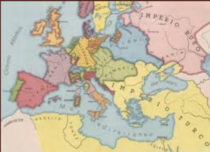
Europa mediados s. XVIII

En el pensamiento de la Ilustración son atributos de la Cultura : la idea de progreso, evolución, educación, razón.